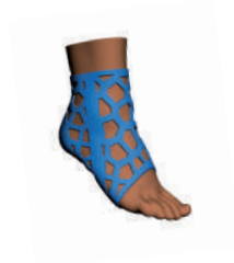
FXT-OIC Estabilizadora Tobillo