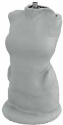
Figura 1: Escaner molde.