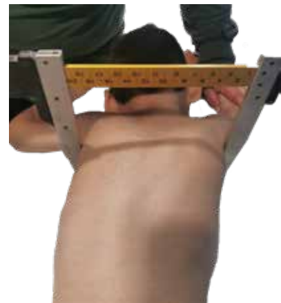
Figura 3: Imágen de ejemplo para la toma de medidas.