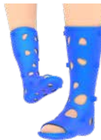
FXT - OIL SUROPÉDICA