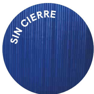
Para el uso de velcro adhesivo o remache .