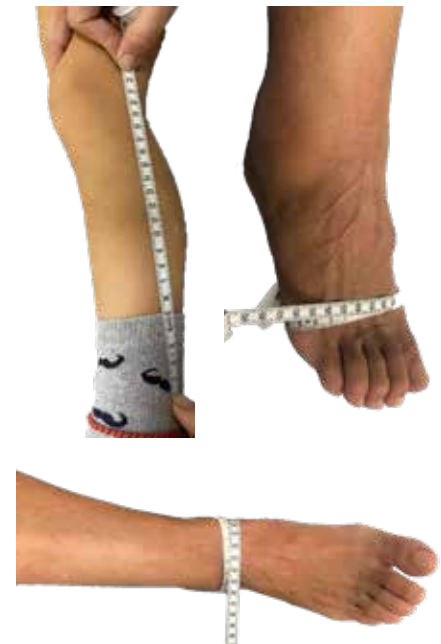
Figura 2: Imágenes de ejemplo para la toma de medidas