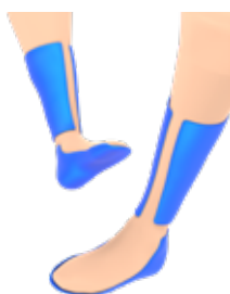
FXT - PTB PTB