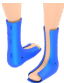
FXT - OIA AFO