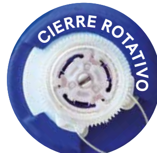
Para una mejor adaptación .