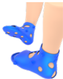
FXT - OIC ESTABILIZADORA DE TOBILLO