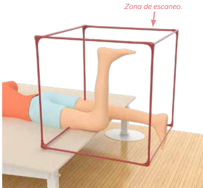
Figura 1: Escaner de paciente con la pierna a 90°, utilizando una superficie de apoyo.