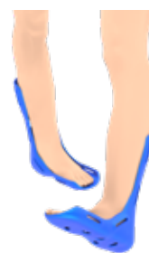
FXT - OIP POSTURAL